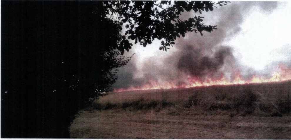
Feu arrivant sur nos habitations.

En effet, cet été un feu a démarré dans le champ en face de nos « Espaces Boisés Classés » et les conséquences aurait pu être dramatiques si nous n'avions pas entretenu le chemin rural dit des Carrières et l'arrière de nos terrains. Les pompiers ont été très clairs, si nous n'avions pas de pelouse et si nos « Espaces Boisés Classés » étaient restés en friche comme la législation nous l'imposait, le feu aurait sûrement atteint les maisons :