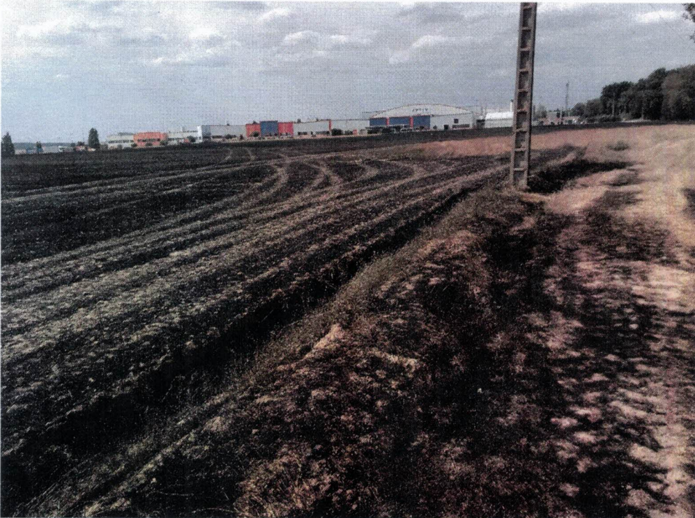
Résultat avec le chemin rural dit des Carrières et une partie de nos arbres brûlés.