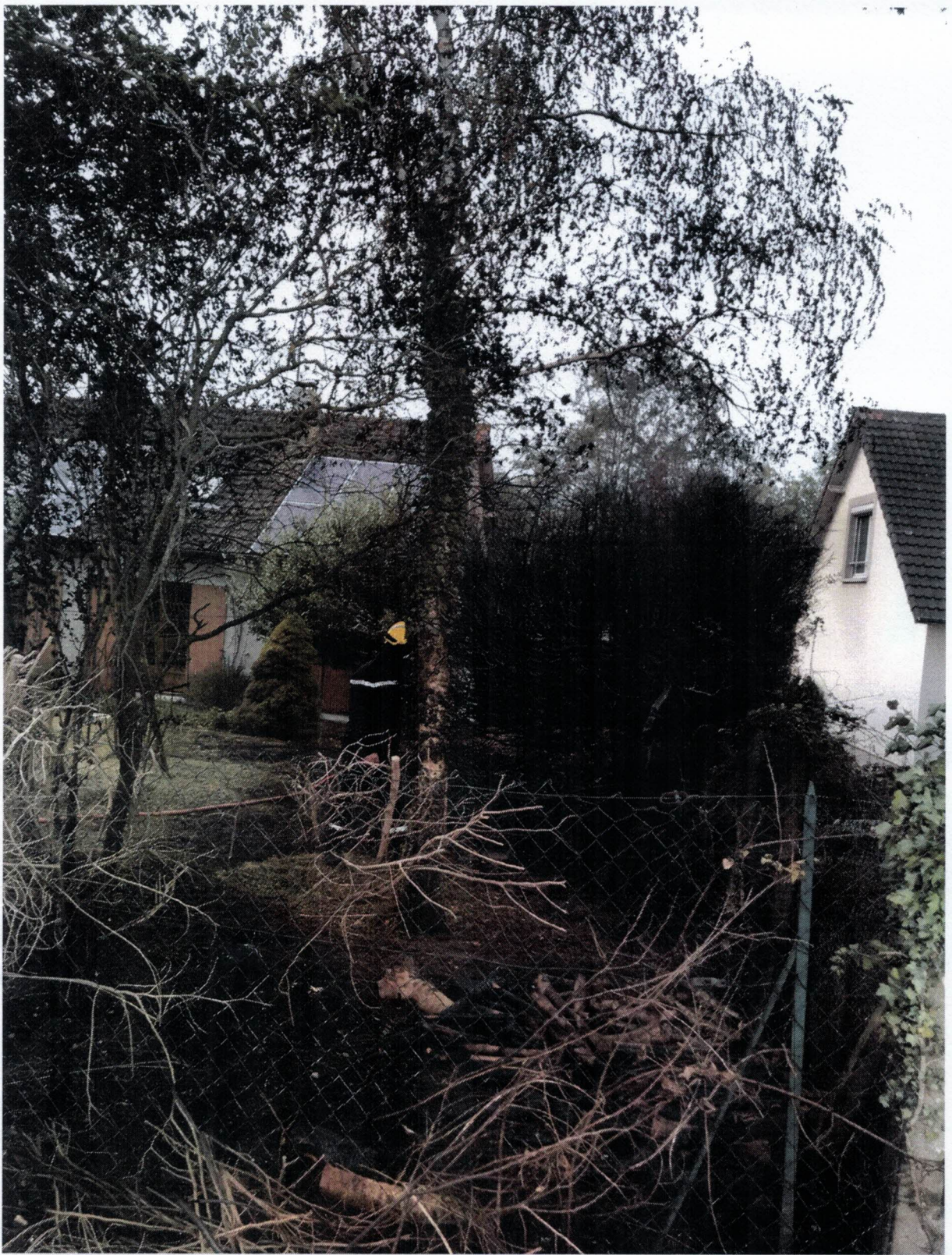
Une haie de jardin dans la résidence des acacias qui n'a pas survécu et qui n'est pourtant pas en zone EBC.