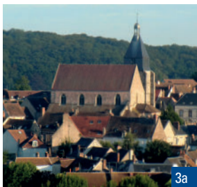
1. Vue depuis le belvédère de la Diane / 2. Les Pressoirs / 3a. L'église Saint-Pierre