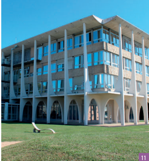
9. L'écluse et le canal du roi / 10. Le Conservatoire des meules et pavés / 11. Le bâtiment principal du CERIB