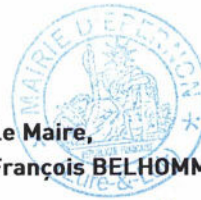
Le Maire, François BELHOMME

Fait et délibéré à Épernon, le 13 mars 2023